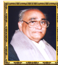
સ્વ. ગોરધનદાસ ઓધવજીભાઈ વાયા